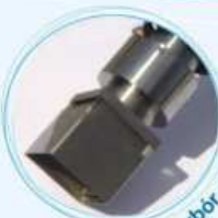
Duży wybór głowic