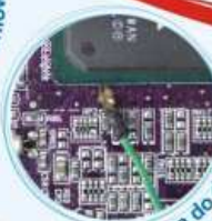
Termopara do dokładnego pomiaru temperatury